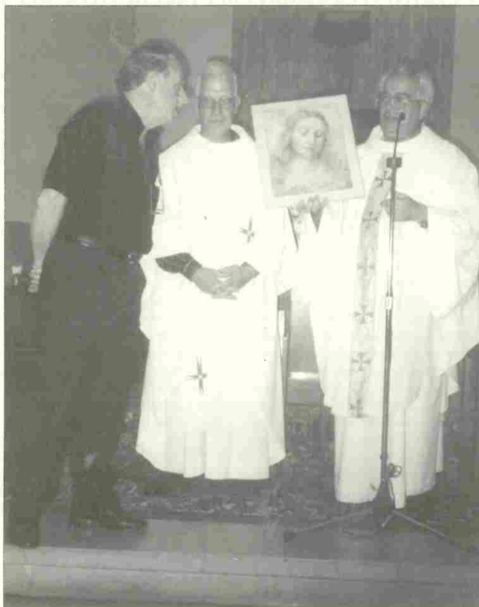
12 Settembre 1999 - Festa Major di Vilanova Dono del Comitato Gemellaggio alla Parrocchia di S. Ilario

oltre alle due pubblicazioni "tecniche" "La fonte scritta e la memoria" e "Archivio Storico del Comune di Calcinaia, Archivio Preunitario (1557-1865)" .