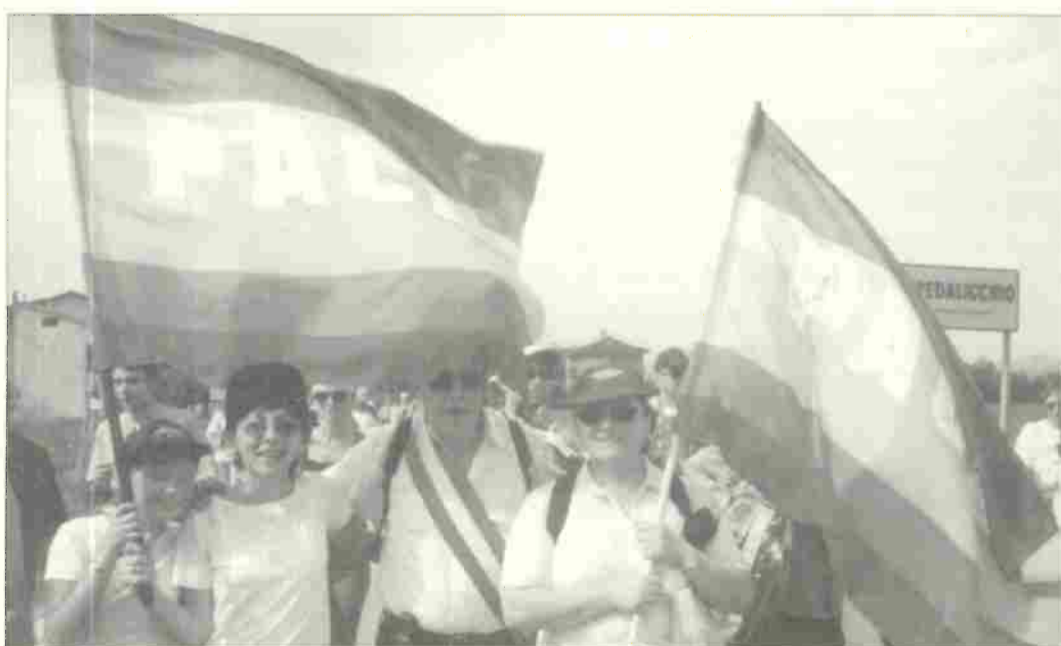
26 Settembre 1999 - Assisi - 12ª Marcia della Pace