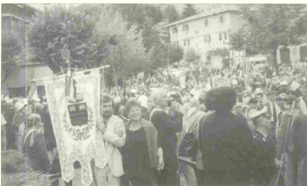
Ottobre 1000 - 55° Anniversario dell'occidio di Marsibotto - Il nonfolano di Calcinaia