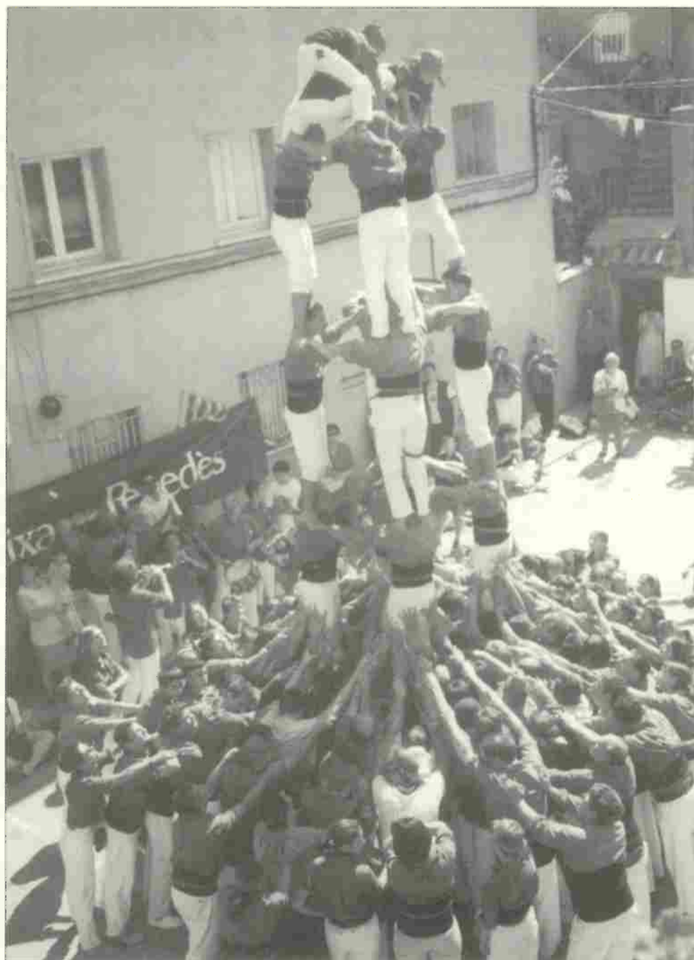
Edizione Catalana "Castells" (Torre umana) nella piazza del Comune di Vilanova del Cal