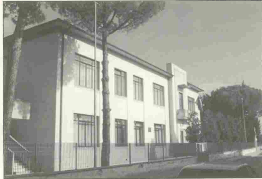
Scuola Elementare Vasco Corsi

Documento approvato a maggioranza nella seduta del 23 Settembre 2003