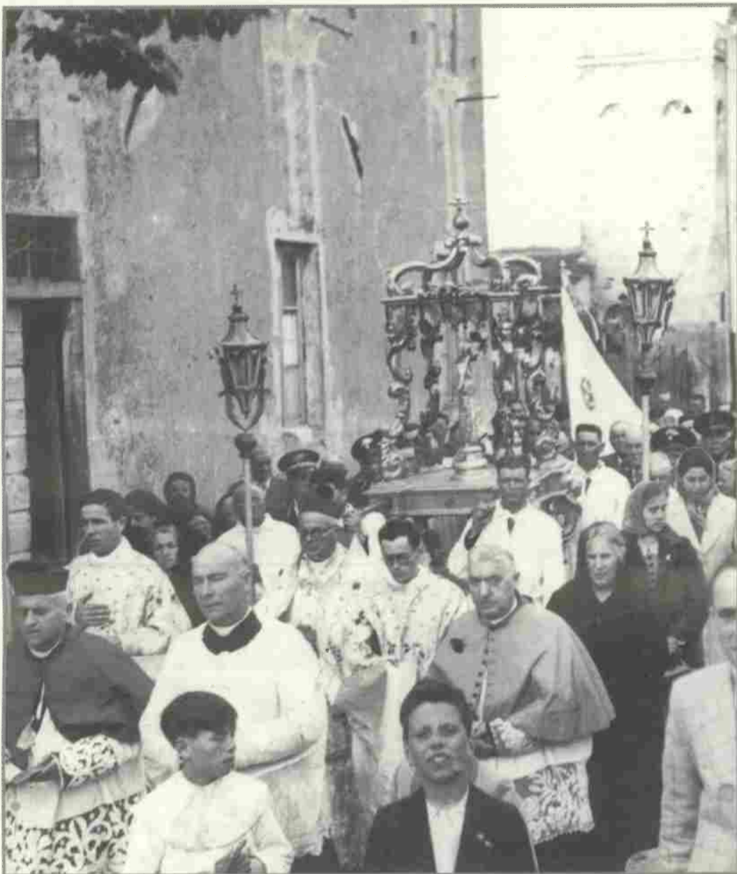
Una edizione della Processione di S. Ubaldesca. Anni '40

Da parte mia e dell'Amministrazione comunale sarà profuso il massimo impegno per esaltare le qualità di Calcinaia e della sua gente.