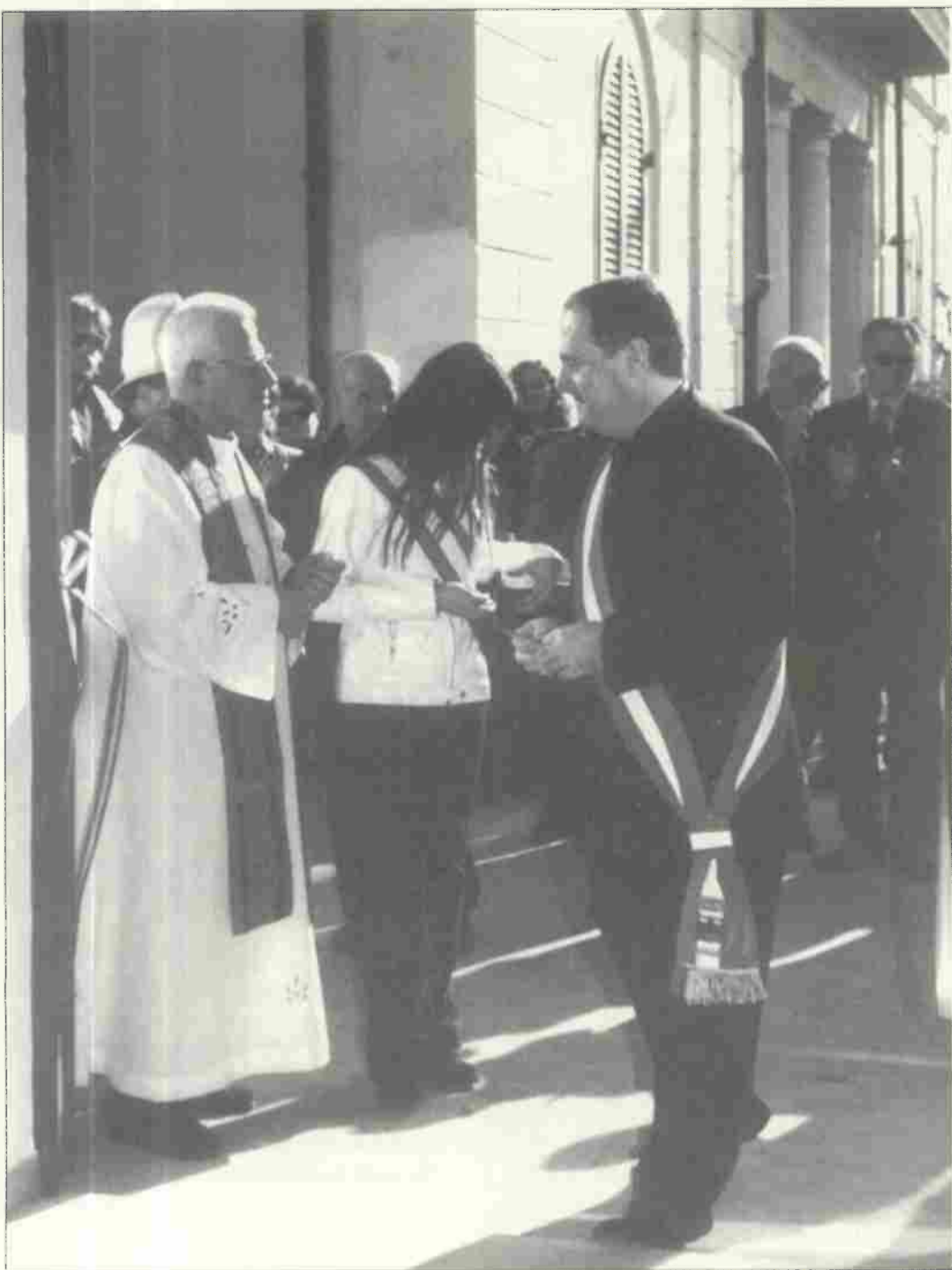
Inaugurazione Sala Polivalente intitolata a Don Angelo Orsini, il Parroco di Calcinaia che nel '44 fu trucidato dai nazisti.

Per informazioni: Comune di Calcinaia telefono 0587.26541