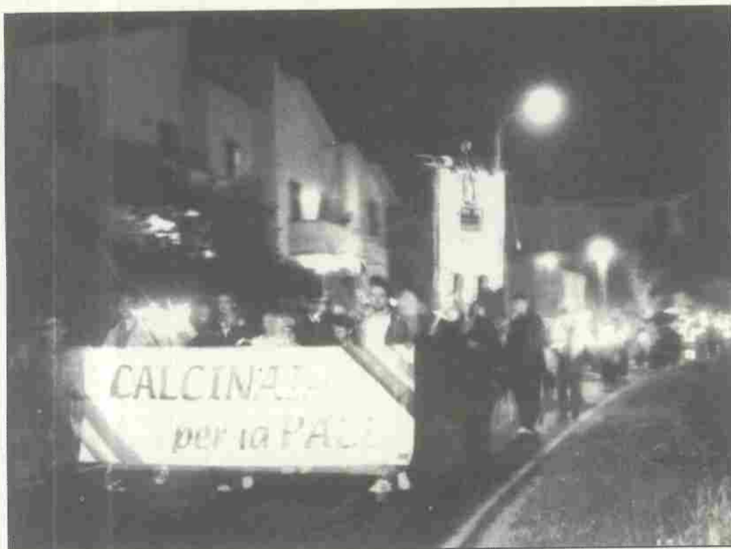
La fiaccolata del 24 aprile 2002: Calcinaia - Fornacette