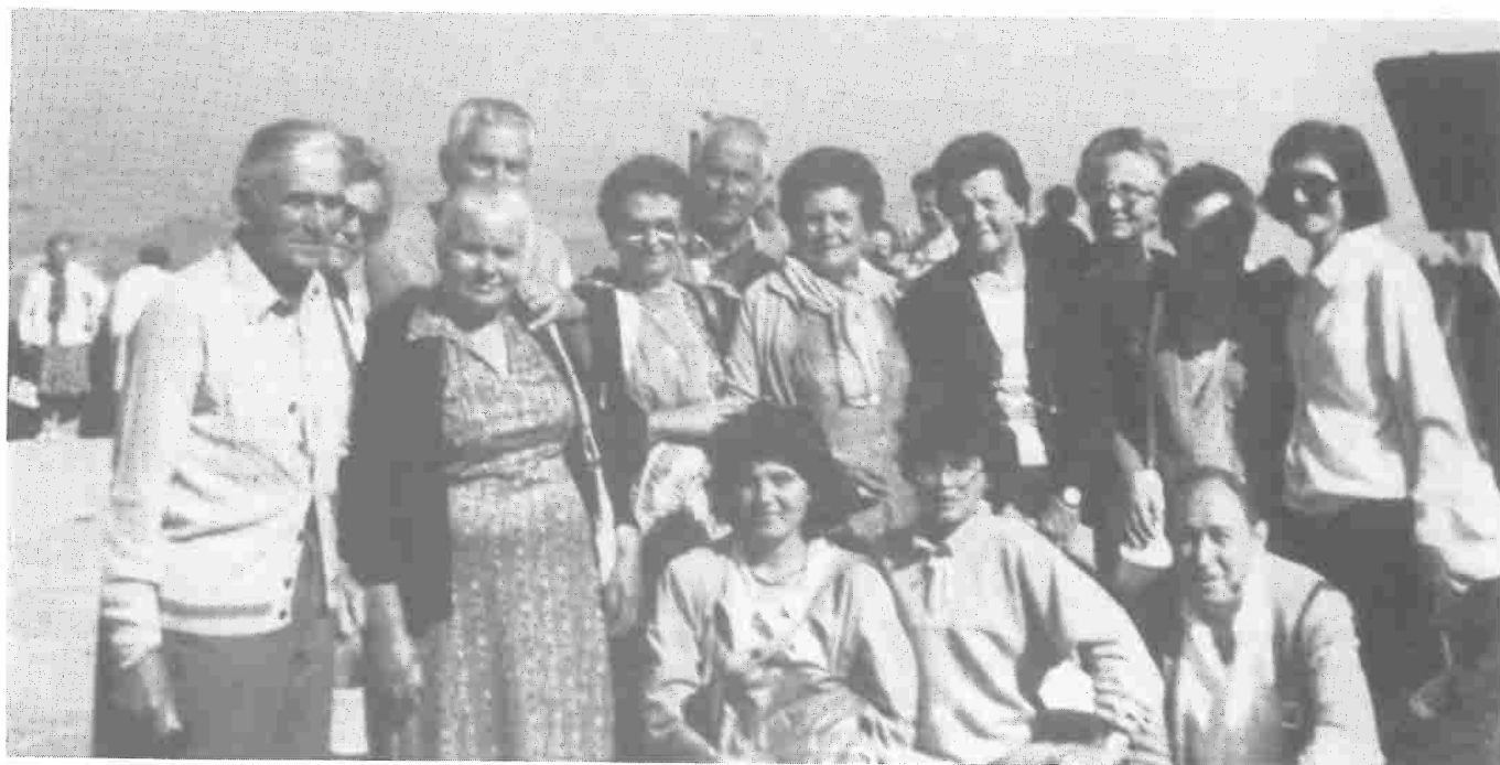
Un gruppo di partecipanti alle vacanze 1987

Non vanno poi dimenticati in questo settore gli impegni che l'Amministrazione insieme all'U.S.L. affronta riguardo alle vacanze anziani e alle vacanze ragazzi.