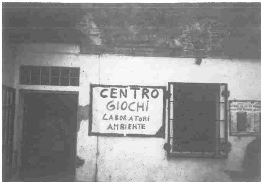
Ingresso alla Sede del Centro Giovani - Via della Chiesa

strascuola" (educazione all'immagine ed educazione all'ambiente) rivolte ai ragazzi dai 6 ai 12 anni, nonché il Centro Giovani , che va ancora potenziato ed ampliato. Non va poi dimenticato lo scambio fra i giovani di diversi Paesi europei, la VI a edizione della Corsa Podistica per la Pace Lugo di Romagna-Calcinai a e le altre iniziative collaterali che con il contributo determinante di tutte le organizzazioni democratiche del territorio, hanno costituito un successo importante per la causa della Pace, esaltando nel contempo i valori del 25 aprile. Inoltre, dopo la pubblicazione del libro fotografico è programmato la redazione di una ricerca storica sul Comune con la collaborazione di esperti che da tempo stanno lavorando a questo progetto.