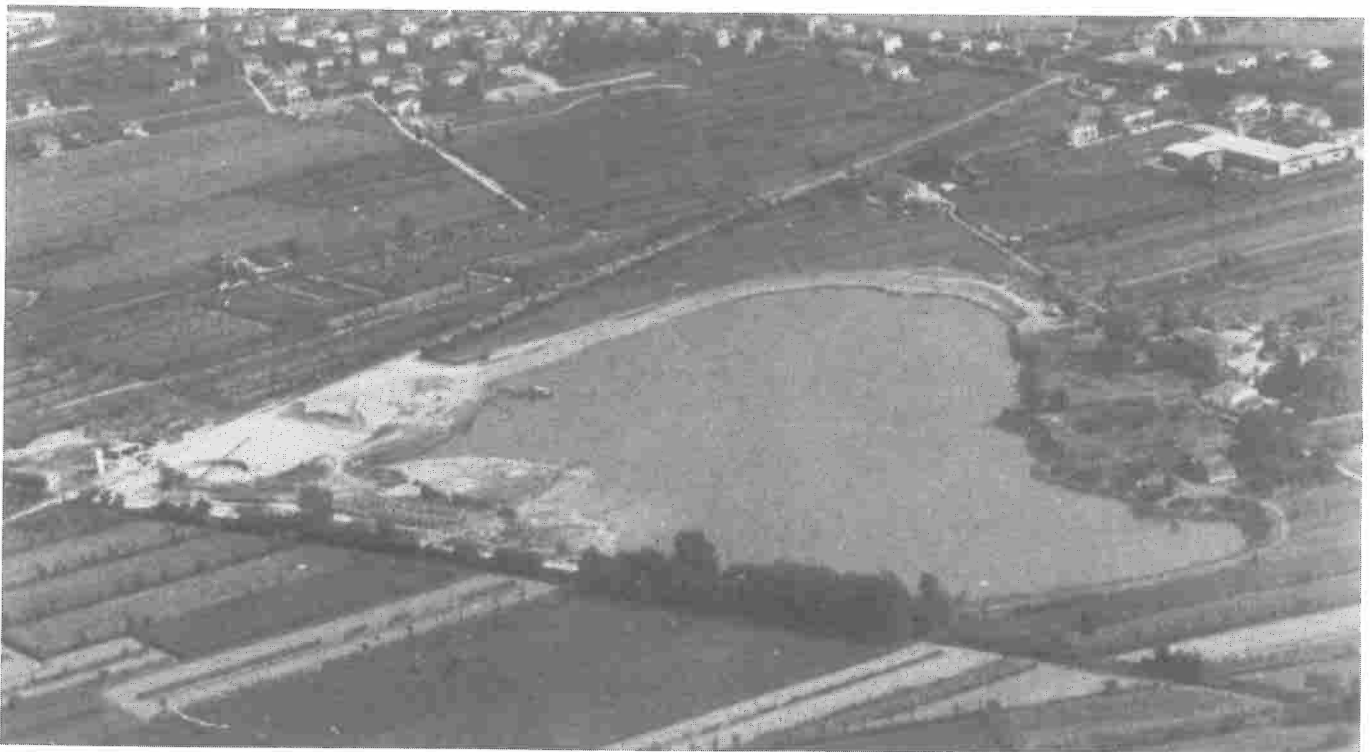
Veduta aerea Lago del Marrucco

Regolatore Generale che prevede molte innovazioni tra cui anche il recupero del Centro storico di Calcinaia , il nuovo Piano della rete commerciale e infine il nuovo Regolamento Edilizio. Con questo importante strumento urbanistico avremo la possibilità di verificare con precisione l'inserimento di zone da destinare ai Piani Pep e Pip , privilegiando il recupero del patrimonio edilizio esistente: sia residenziale che industriale-artigianale, a tale scopo abbiamo interesse, con un apposito documento, il Consiglio comunale .