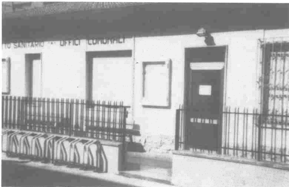
Sede decentrata del Comune a Fornacette

Il sindaco riceve il pubblico alla sede del Consiglio di Circostrizione - uffici comunali TUTTI I GIOVEDI dalle 10 alle 12.