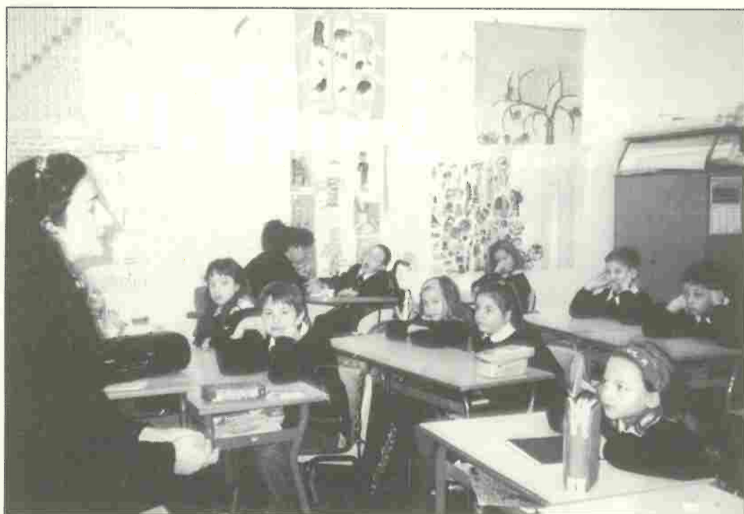
Gli alunni e le insegnanti delle classi II di Fornacette.

Gli alunni e le insegnanti delle classi 2 e di Fornacette