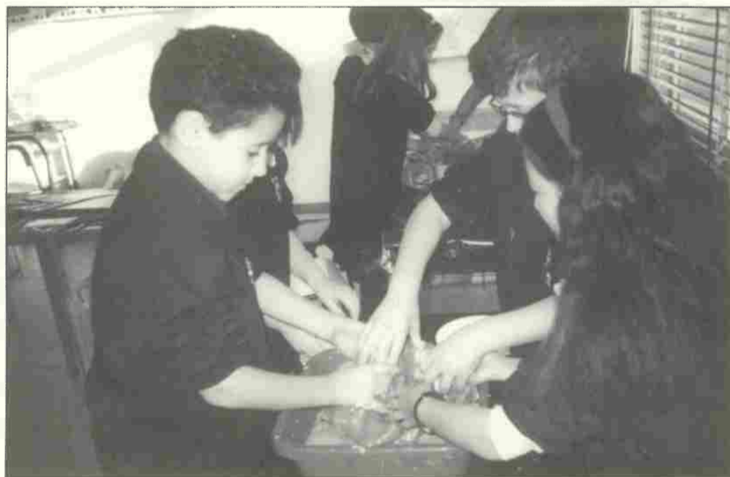
Bambini in attività. Lavoro di gruppo, nel laboratorio di libera espressione, per la costruzione di scenografie e costumi. Classe III a Fornacette - Via Morandi