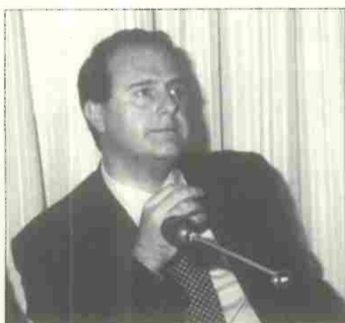
Valter Picchi - Sindaco di Calcinaia