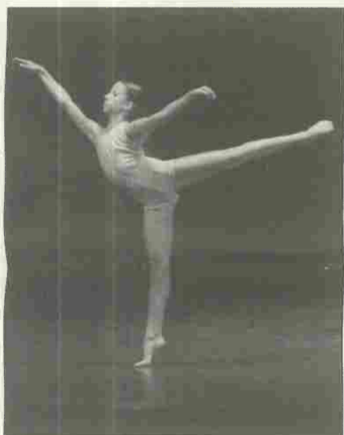
I.A.S. ...emozioni Istituto d'Arte e Spettacolo

Al termine di ogni anno accademico vengono rilasciati attestati di frequenza e dichiarazioni per il riconoscimento dei crediti scolastici.