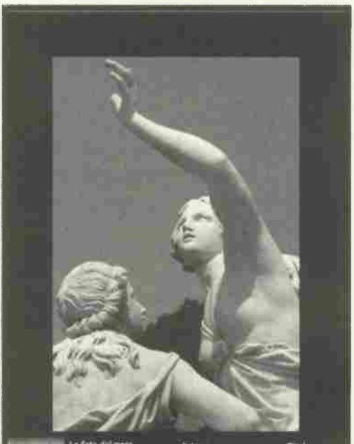
La foto del mese

ANCI, consiglio delle autonomie locali, Unioncamere toscana e Poste Italiane S.p.A. per la spedizione di comunicazione tramite postatarget che, all'articolo 4 individua l'obiettivo di consegna in 5 giorni lavorativi successivi a quello di spedizione per l'85% degli invii, salvo quelli eventualmente migliorativi. I tempi registrati sono stati superiori a qualsiasi previsione negativa che potesse essere pronosticata al proposito, vanificando quello che costituisce il principale obiettivo che questa Amministrazione si è data con la diffusione di un periodico: raggiungere in modo capillare e sistematico i più ampi strati di popolazione, realizzando livelli di comunicazione i più estesi possibile e fornire una informazione aggiornata sui principali avvenimenti e argomenti di interesse istituzionale. È ovvio che la congruità e la celerità dei tempi di consegna costituiscono la condizione indispensabile per evitare la dispersione di risorse se non addirittura, come nel caso richiamato, per evitare di apparire ridicoli formulando gli auguri di Natale o di buon anno in prossimità delle vacanze di Pasqua. Richiamo quindi Poste Italiane ad un maggior rispetto delle condizioni contenute nell'accordo e invito gli altri enti sottoscrittori ad adoperarsi in questa direzione.