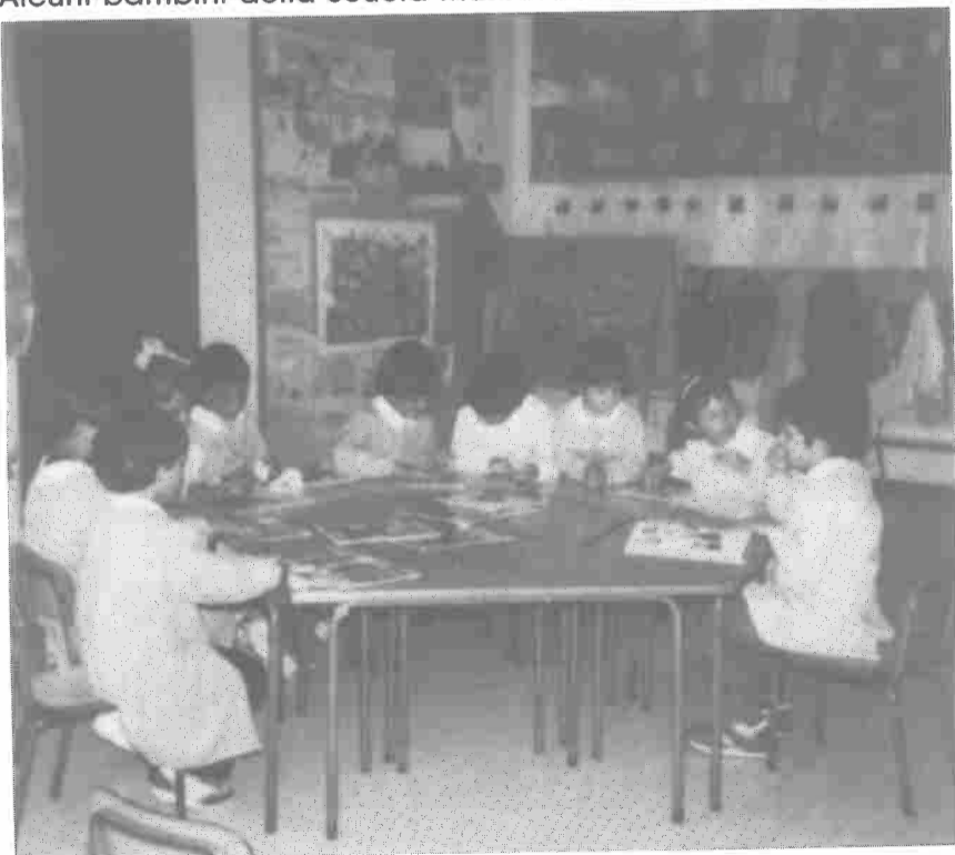
Alcuni bambini della Scuola Materna Statale di Calcinaia

Gli animatori del Laboratorio Ambiente ARCI RAGAZZI