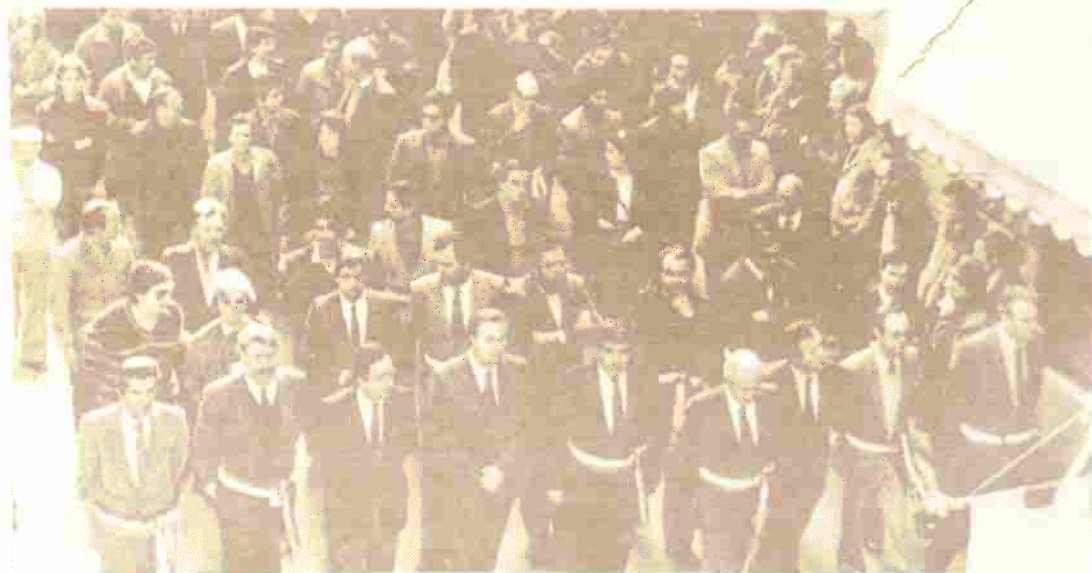
I Sindaci aprono il corteo della recente manifestazione dei Piaggisti a Pontedera (da "Il Tirreno" del 20.04.1984)

Al momento di andare in macchina, purtroppo sono già arrivate 130 lettere di messa in cassa integrazione ad altrettanti nostri concittadini : dopo la Pistoni Asso che già aveva dato un grave scossone alle economie familiari del nostro Comune si aggiunge ora la grave crisi della Piaggio. L'Amministrazione comunale mentre esprime la piena solidarietà ai lavoratori in lotta per il mantenimento del posto di lavoro, garantisce il più completo impegno per cercare insieme ai sindacati, ai partiti e alle istituzioni una positiva soluzione della vertenza.