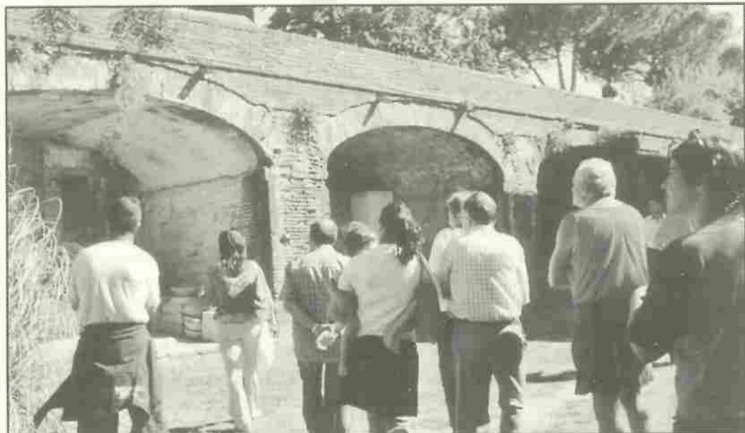
Visita al Trabocco