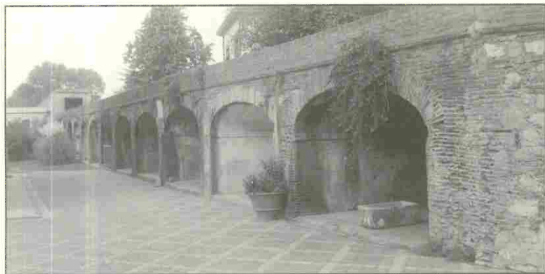
Gli archi del Trabocco