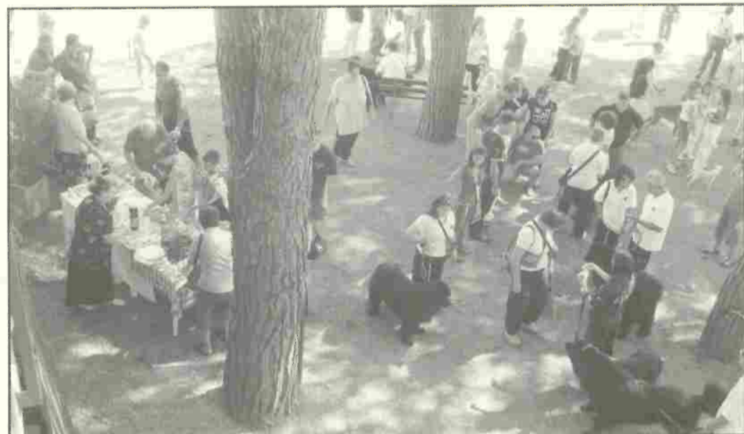
Mostra Canina al Parco dei Pini