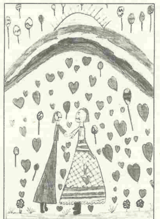
In classe relativamente alla loro partecipazione al Convegno hanno detto: