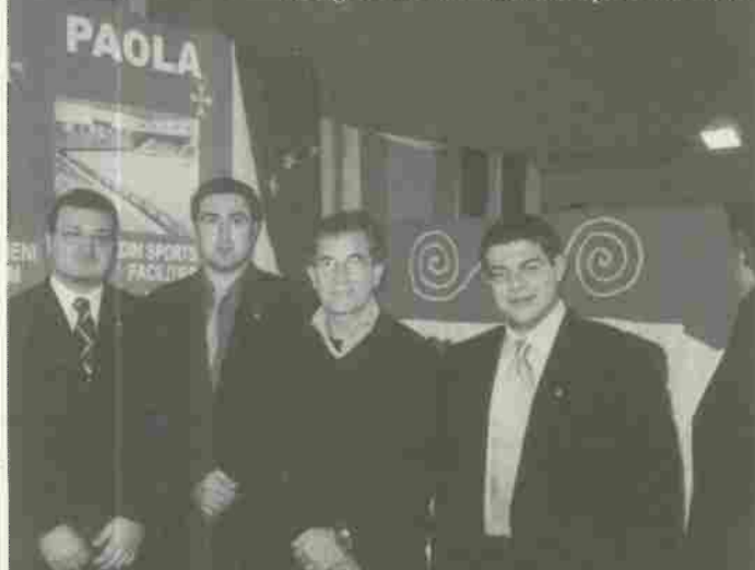
Delegazione di Paola a Expò-Pisa 2004

l'immagine della nostra patrona l'abbiamo incontrata nella città di Paola e nella concattedrale di S. Giovanni alla Valletta, come l'avevamo incontrata, incredibilmente reale, in una piccola cappella di Les Useres. Lei si spostò soltanto, ma non semplicemente, da Calcinaia a Pisa eppure con stupore e anche con profonda emozione la ritroviamo in luoghi tanto lontani con il suo abito nero, la croce a otto punte e quella secchiella che la caratterizza per l'umiltà e la dedizione agli altri. A Noves, a Vilanova del Camí, ad Hopsten non abbiamo trovato immagini della nostra Santa ma fra i cavalieri di Malta c'erano fra gli altri anche francesi, tedeschi, spagnoli e altri ancora uniti da una fede comune in un mondo diviso su tutto. Anche oggi dobbiamo avere fede, religiosa o laica nel bisogno di pace degli uomini.