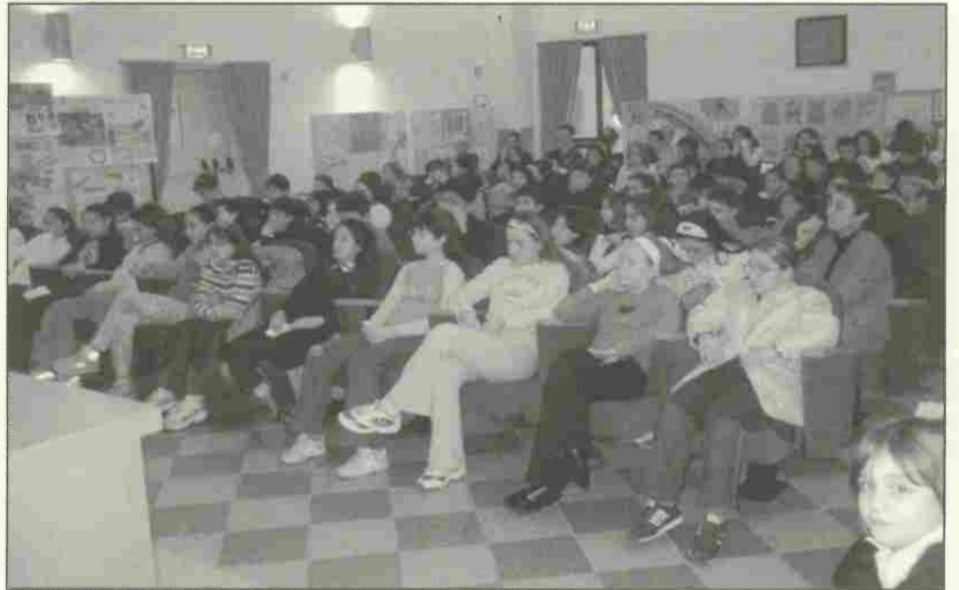
I bambini più piccoli delle classi prime di Fornacette hanno presentato la filastrocca "Dopo la pioggia" di G. Rodari, hanno cantato "L'arcobaleno" e hanno espresso i loro pensieri di pace attraverso i disegni:

La pace è bella, non è come la guerra che porta morte, fame e distruzione. La pace è amore e gioia. Si spera che la pace tornerà perché solo la pace può donare gioia, amore e felicità. (Michael)