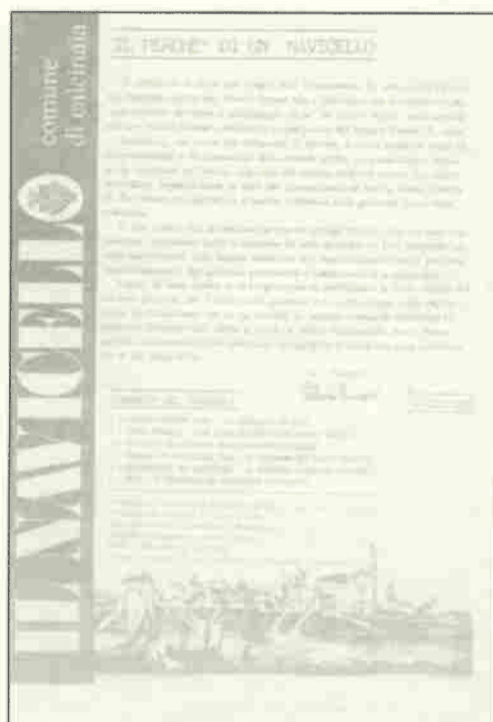
La copertina del N. 1 - Anno 1984