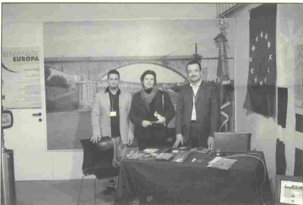
Dire & Fare 2005 - Lo stand di Calcinaia