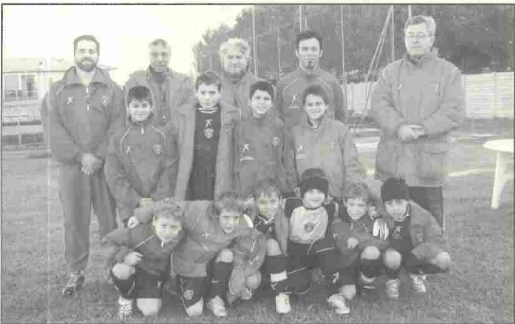
Piccoli Amici - classe 1997

La Polisportiva Nevilio Casarosa augura a tutti Buone feste e Felice Anno Nuovo, in particolare ai propri ragazzi e ragazze iscritti che sono invitati con i loro genitori alla festa di Venerdì 23 Dicembre alle ore 21:00 alla Discoteca Freedom.