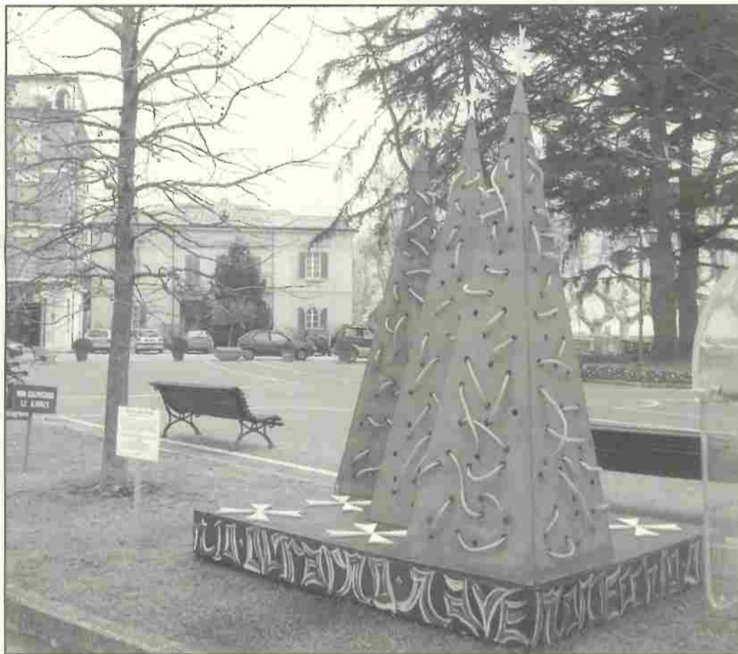
Gli alberi di Natale dei Rioni Storici di Calcinaia