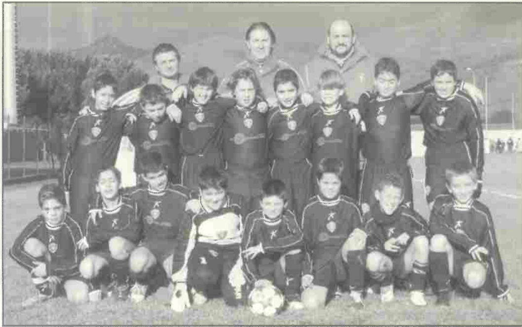
Pulcini - classe 1995