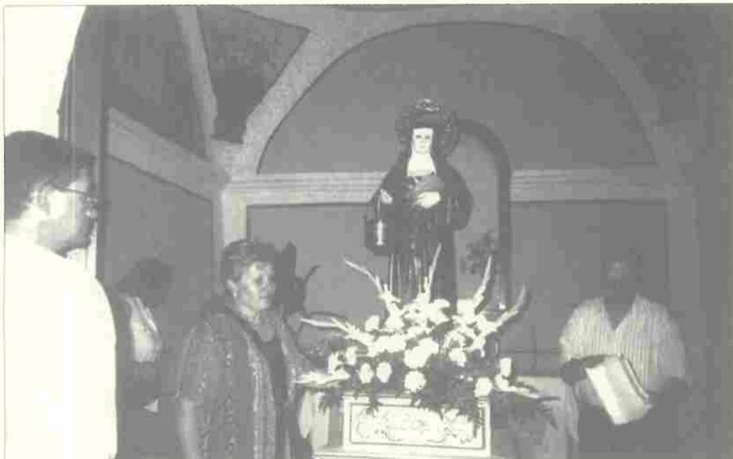
Santa Waldesca di Les Useres

Con questo articolo abbiamo voluto fornire una sintesi della notevole attività svolta dal Comitato di Gemellaggio, dalle associazioni, dal comune, dalle scuole, da tutta Calcinaia per testimoniare la volontà di mantenere il nostro paese collegato all'Europa con legami di cultura, amicizia e di cooperazione economica. I premi della Comunità Europea sono frutto di questo impegno.