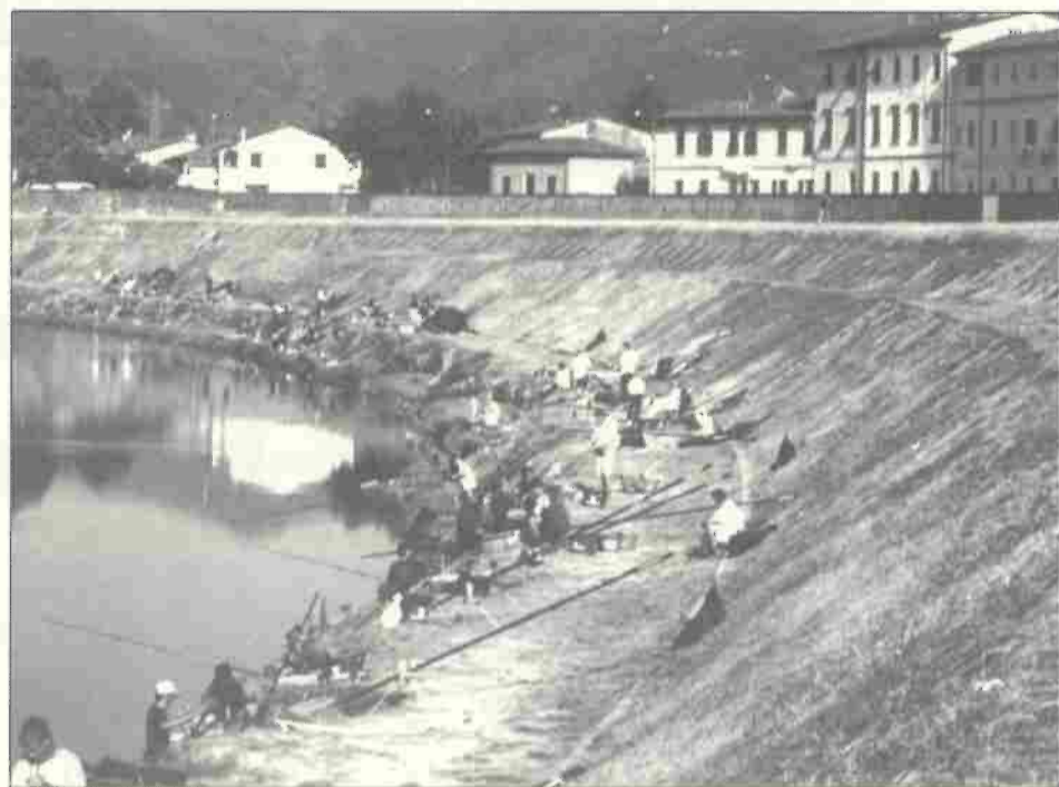
L'Arno a Calcinaia