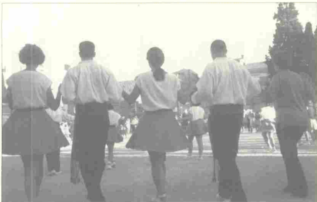
Concorso di Sardanà a Vilanova