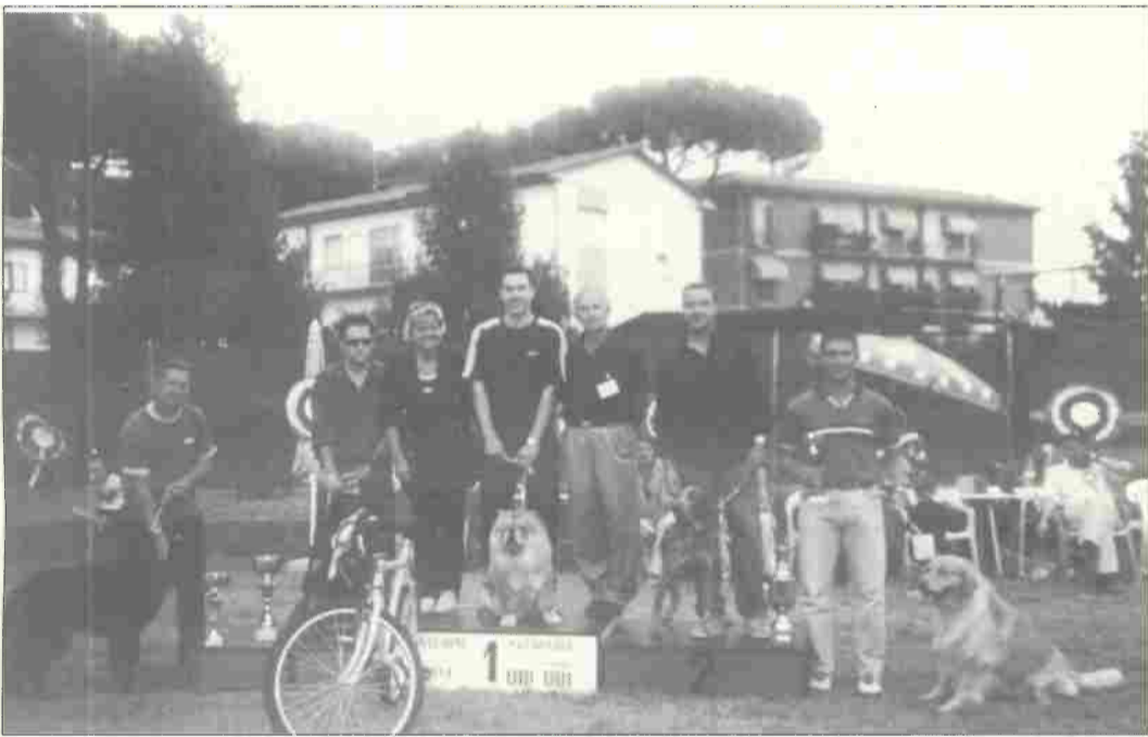
4° Trofeo Ubi-Ubi 2000