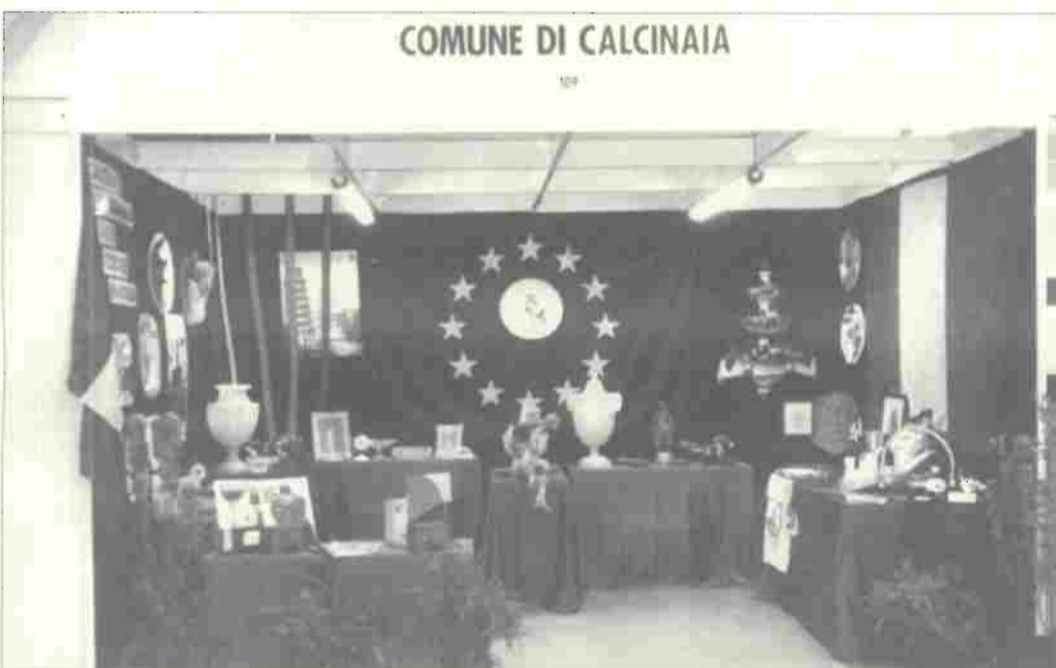
Stand del Comune di Calcinaia alla 77ª Fiera Multisettoriale di Igualada