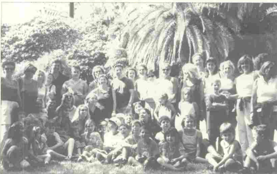
In gita a Genova