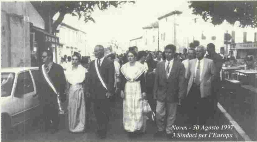
Noves - 30 Agosto 1997 3 Sindaci per l'Europa