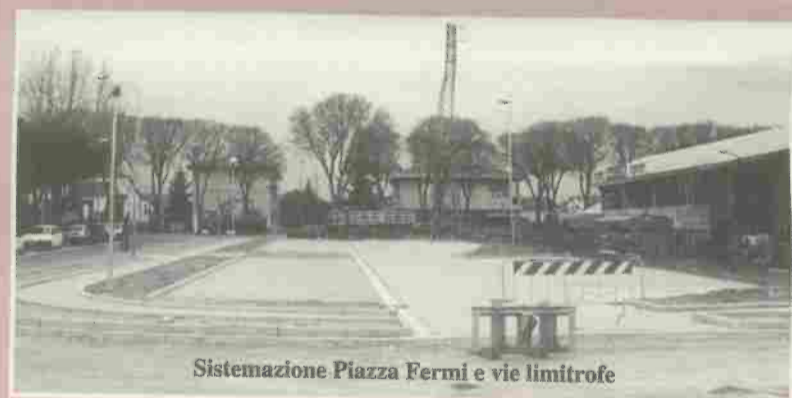
Sistemazione Piazza Fermi e vie limitrofe