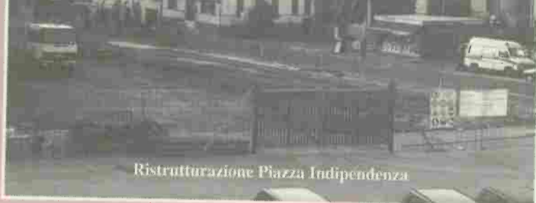
Ristrutturazione Piazza Indipendenza