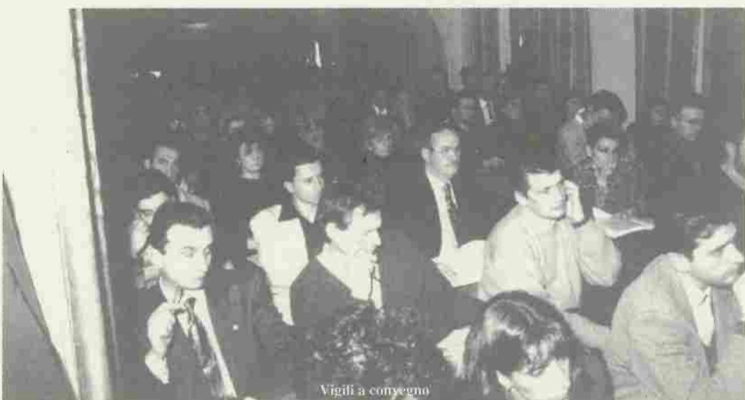
Vigili a convegno

•Si sono dati appuntamento l'11 febbraio scorso al Calamidoro Hotel i Vigili Urbani di tutta la Toscana aderenti all'A.N.C.P.U.M., l'Associazione Nazionale della Polizia Municipale. Una giornata di studio per comprendere meglio i problemi, le normative vecchie e nuove, dei compiti, spesso delicati, affidati alla Polizia Municipale.