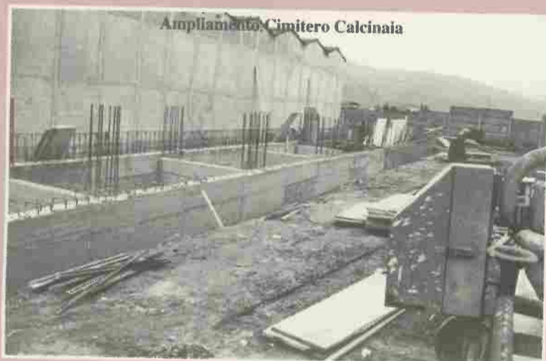
Ampliamento Cimitero Calcinaia