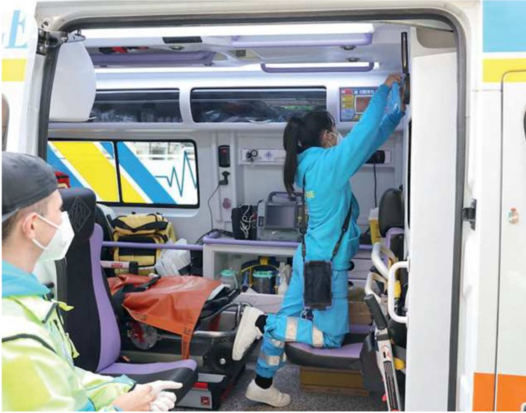
Volontari pronti per effettuare un servizio in ambulanza