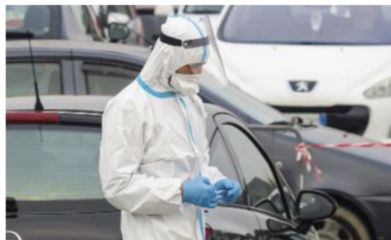
In aumento il numero dei contagiati nell'ultima settimana

Ieri il Comune con il più alto tasso di positività su 100mila abitanti è stato Castelnuovo Valdicecina che, con 30 nuovi positivi, fa balzare a 1.411 su 100mila. Segue Bientina con 71 (834), Palaia (35, 769 su 100mila), Pomarance 40 (725), Crespina Lorenzana 33 (611), Buti 31 (556), Calcinaia (50 (554), Capannoli 35 (548), Santa Maria a Monte 71 (536), Casciana Terme Lari 62 (502), Orciano Pisano 3 (476), Peccioli 21 (451), Terricciola 19 (425), Guardistallo 5 (425), Pontedera 121 (413), Volterra 18 (183), Fauglia 6 (164).