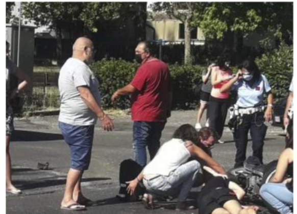
L'arrivo dei soccorsi: il 21enne è ricoverato a Cisanello

ARTICOLO NON CEDIBILE AD ALTRI AD USO ESCLUSIVO DEL CLIENTE CHE LO RICEVE - 4671