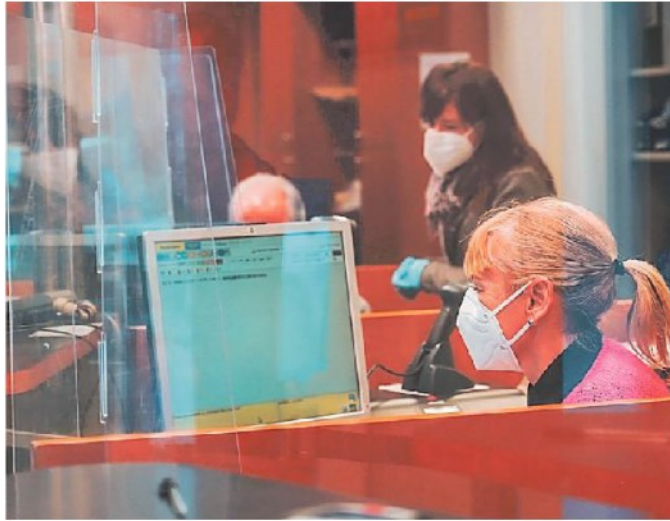
Un ufficio postale