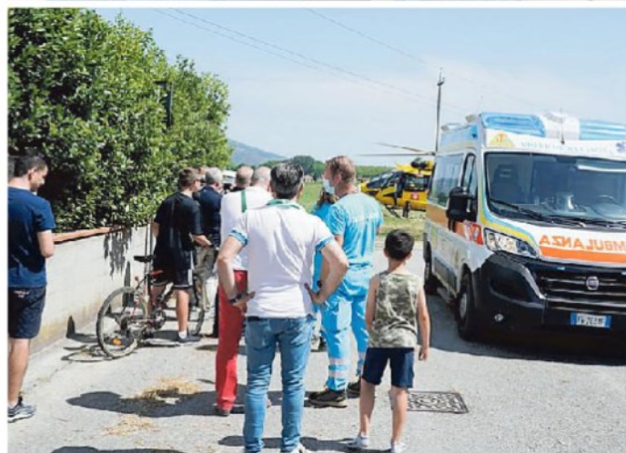
I mezzi coinvolti nell'incidente stradale a Fornacette e i soccorsi con l'intervento del Pegaso