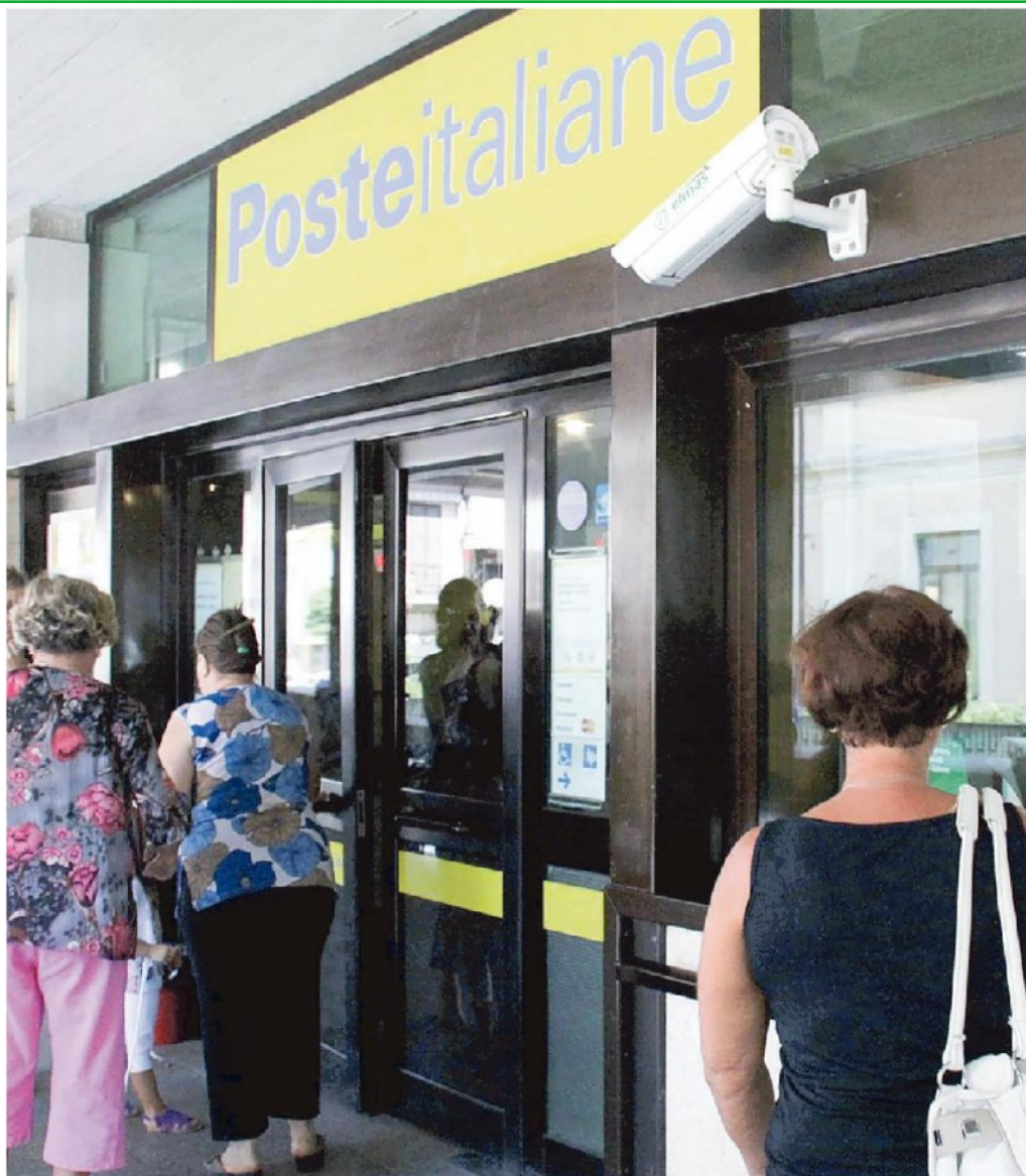
Cittadini in attesa davanti a un ufficio postale