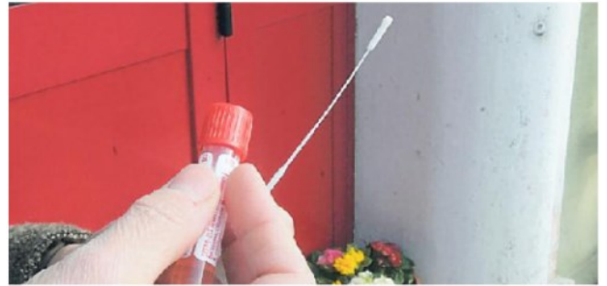
Lo stick per effettuare il tampone sulla positività al Covid

IL BOLLETTINO SANITARIO DI PISA E PROVINCIA