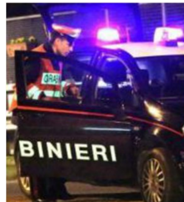
Momenti di paura ieri al Mc Donald's di Fornacette, dove un cliente ha aggredito un giovane addetto

4671 - ARTICOLO NON CEDIBILE AD ALTRI AD USO ESCLUSIVO DEL CLIENTE CHE LO RICEVE