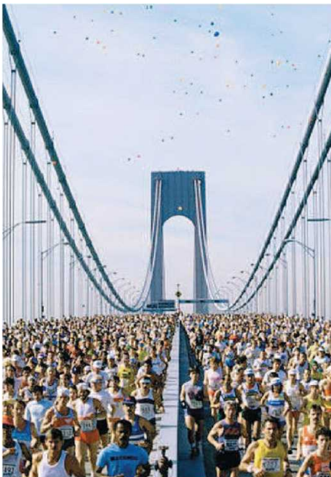
I partecipanti ad una Maratona di New York sul Ponte da Verrazzano