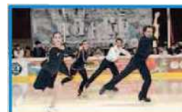
Ultimo dell'anno da "brividi" alla pista del ghiaccio alla stazione. Si pattina fino all'alba