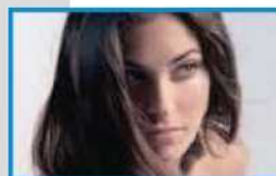
Al Centro Torretta White grande evento con la bella Ariadna Romero, l'attrice del film di Pieraccioni