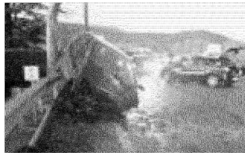
L'incidente lungo via della Botte a Fornacette