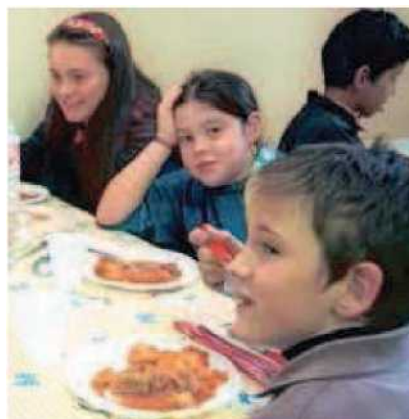
A TAVOLA Basta un sms per visionare il credito dei servizi mensa

INVITANDO tutti gli utenti a servirsi di questa opportunità sia per tenersi aggiornati sul credito residuo contenuto nella propria tessera, sia per informarsi sulle ultime notizie relative al Comune, l'amministrazione calcinaiola si scusa con tutti i genitori «per questo periodo di assestamento che si è protratto per qualche mese». Il servizio darà attivo d'ora in avanti per l'intero anno scolastico.