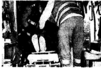
Personale del 118 intento a prestare soccorso ad un ferito grave

Mentre quattro giovani tra i 20 e i 22 anni sono rimasti feriti in un incidente stradale avvenuto la notte tra Natale e Santo Stefano a Lido di Camaiore. Guidava l'auto una ventenne che ha perso il controllo finendo contro un albero. I quattro feriti sono stati portati all'ospedale Versilia, nessuno è in pericolo di vita: il più grave è un 22enne poi trasferito all'ospedale di Livorno con prognosi di 40 giorni.