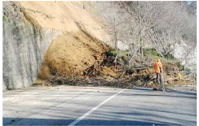
La frana caduta sulla strada provinciale Francesca e, accanto, i lavori di ripristino