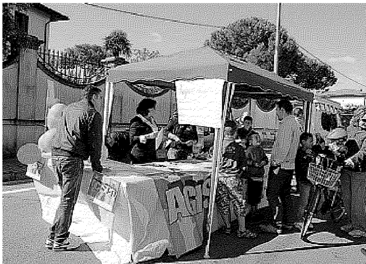
IN CENTRO Una scorsa edizione di una festa a Fornacette

La sesta edizione della festa di Fornacette. Stasera il via con le miss