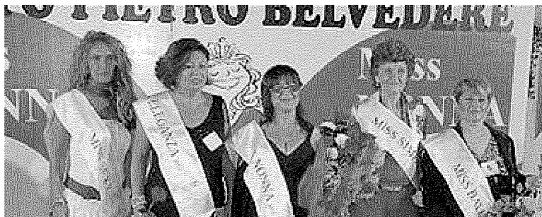
Un'edizione passata di Miss Nonna Più: a Santo Pietro torna il concorso dedicato alla bellezza over 50