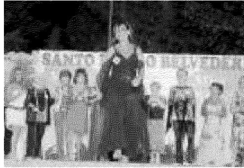
La passata edizione del concorso