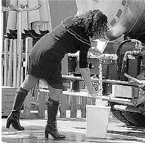
EMERGENZA Una residente di Fornacette fa rifornimento d'acqua all'autobotte