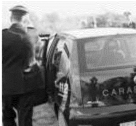
Una pattuglia dei carabinieri di Calcinaia durante un controllo

I risultati delle indagini effettuate dai carabinieri sono stati inviati anche alla Procura di Pisa per gli aspetti che riguardano il maggiorenne indagato in stato di libertà. Mentre per il sedicenne, forse per il timore che potesse reiterare il reato, il Gip presso il tribunale dei minorenni ha emesso un provvedimento di arresto.