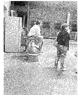
I SOCCORSI Sul posto è arrivata un'ambulanza della Misericordia di Fornacette con medico a bordo