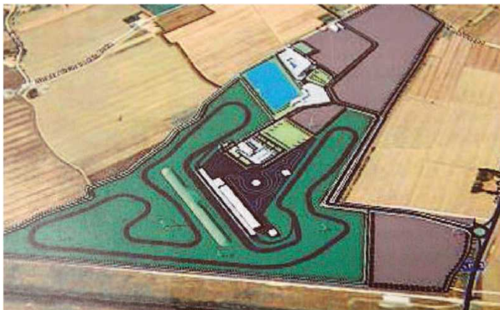
Un'immagine dall'alto dell'autodromo