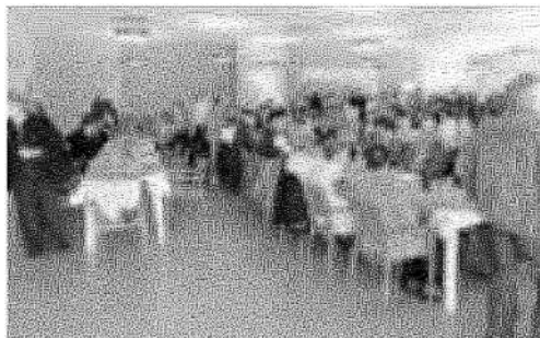
La tavolata degli ex dipendenti della Pistoni Asso durante il raduno