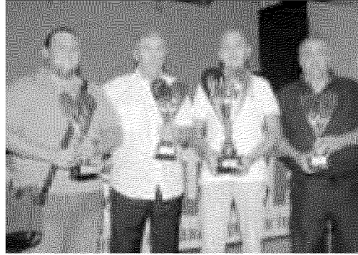
Due momenti della serata di premiazione degli Amatori Valdera