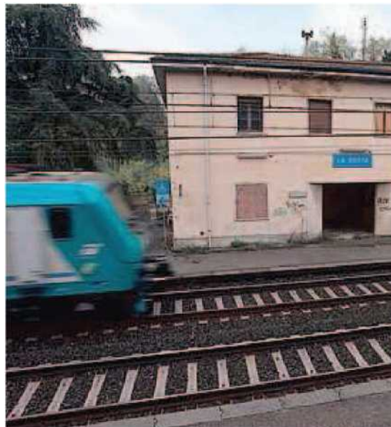
DEGRADO Quel che resta della stazione de La Rotta