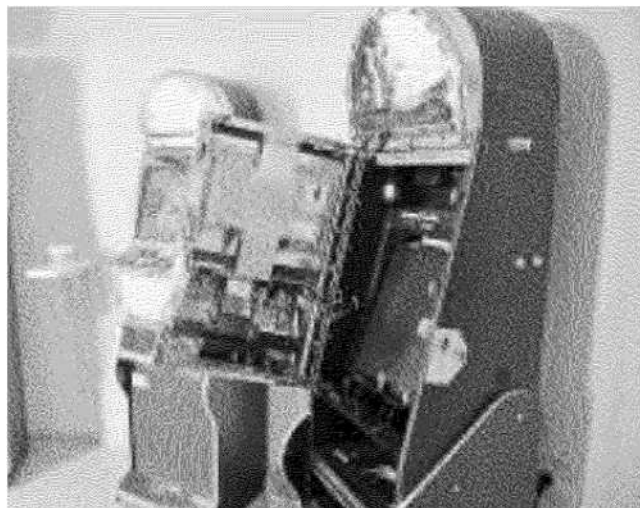
Una macchinetta per i videogiochi sventrata dai ladri