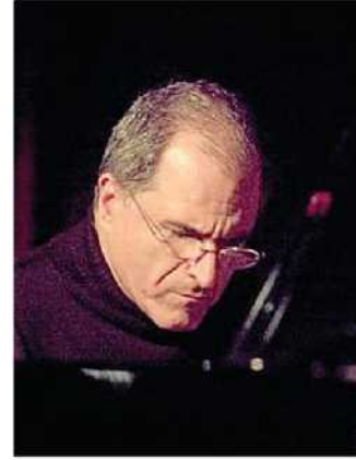
Il pianista Enrico Pierannunzi

Un trio pressoché inedito domani sul palco del Cavatappi-SpiritoJazz per il secondo concerto della stagione del club gastronomico-musicale. Enrico Pierannunzi al piano, Ares Tavolazzi al contrabbasso e Enzo Zirilli alla batteria. Enrico Pierannunzi è un grande maestro del jazz. Come compositore ha firmato oltre 200 pezzi, alcuni dei quali diventati dei veri e propri standard e inclusi nella celebre raccolta The New Real Book. Cena alle 20,30, concerto alle 22,30. Info: 0587 56440 e 53755.