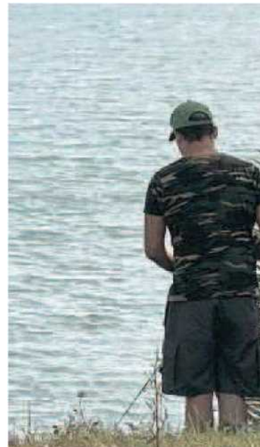
AMBIENTE I lavori al Pian di Vico saranno realizzati dalle stesse aziende proprietarie