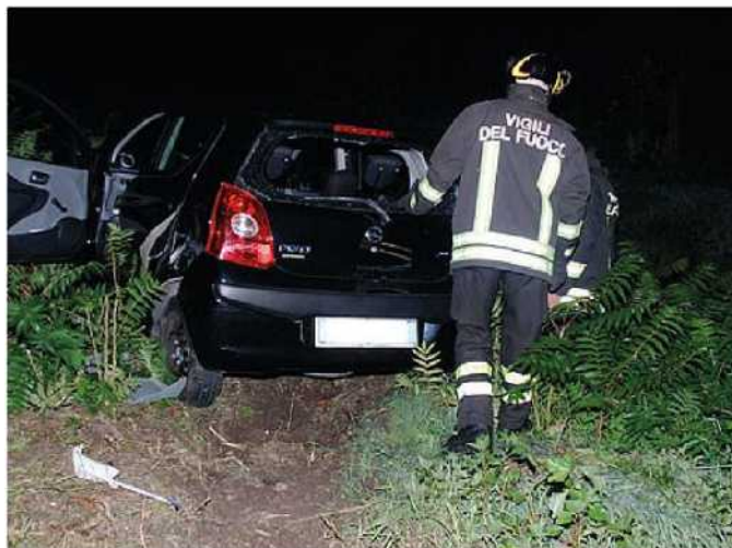
L'auto finita lungo il fosso dell'Arnaccio