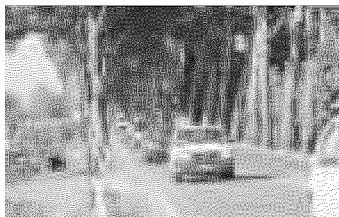
Auto in fila sulla Vicarese