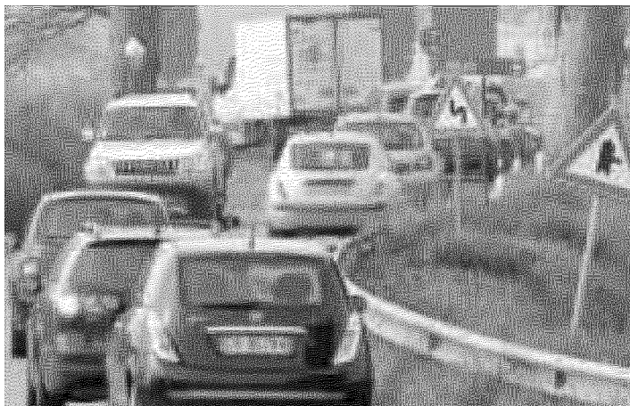
STRADE PERICOLOSE. Traffico sulla via del Brennero

Secondo l'articolo 2051 del codice civile ("Danno cagionato da cosa in custodia"), ciascuno è responsabile del danno cagionato dalle cose che ha in custodia, salvo che provi il caso fortuito. È questa la norma richiamata dalla Cassazione nelle sentenze in merito alla manutenzione delle strade.