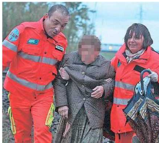
LIETO FINE L'anziana donna tra le braccia dei soccorritori: le ricerche sono andate avanti per oltre un'ora, fino alle 20.35

una borsa da donna marrone. Vuota, senza documenti, solo un fazzoletto e pochi spiccioli. Non ci sono tracce di sangue, non ci sono i resti di un cadavere. Mentre il traffico ferroviario sulla tratta Firenze-Pisa viene bloccato (e i treni in viaggio vengono fermati), si inizia a cercare fra i cespugli che costeggiano la ferrovia. Se qualcuno si è gettato sotto il treno, come afferma il macchinista, può anche essere stato sbalzato lateralmente e magari è ferito, si può ancora salvare. E' quello che sperano tutti, soccorritori, agenti della polizia ferroviaria e carabinieri, curiosi richiamati a frotte dalle sirene. Poi il miracolo, una voce che chiama dal fossato sottostante, ad un centinaio di metri dal punto in cui il treno si è fermato. E' un'anziana, un po' confusa, ma incolume. Il treno l'ha colpita e scagliata nel fossetto sottostante. Cercava il suicidio, ha trovato l'abbraccio dei soccorritori che l'hanno avvolta nella coperta termica e accompagnata all'ospedale. E alla fine sono riusciti anche a strapparle un sorriso.