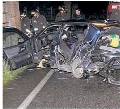
CARASSA Una delle auto rimaste coinvolte nella raffica di incidenti verificatisi nella notte di sabato

un'altra vettura condotta da un giovane marocchino che si è dato alla fuga. Le tre donne, una di 57, una di 71 e una di 31 anni, della provincia di Firenze, sono ricoverate al Lotti. Ferito anche il marocchino poi rintracciato dai carabinieri a Treggiai. Per lui sequestro dell'auto e ritiro della patente. Sos anche per quattro ragazzi di 19 anni finiti fuori strada intorno alle 3 di notte a Calcinaiia e una ragazza di 23 anni che si è ribaltata con l'auto nel sottopasso del Romito in superstrada quasi all'alba.