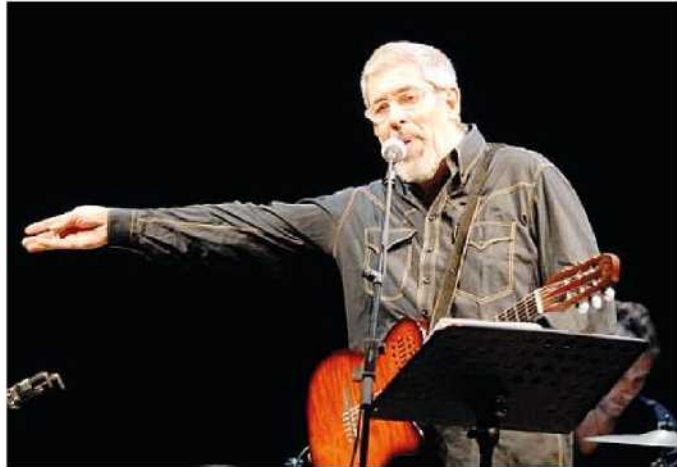
Alessandro Benvenuti tra poesia e musica al Cavatappi