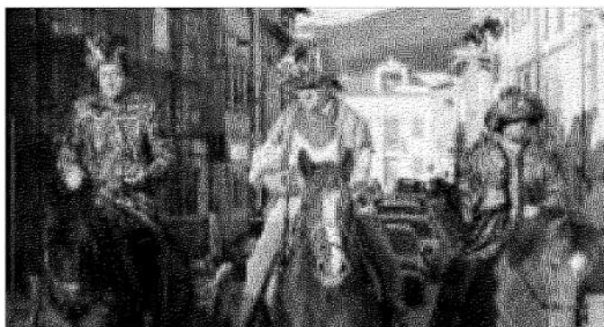
L'arrivo, a cavallo, dei Re Magi a Calcinaia