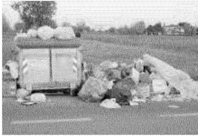
Un cumulo di rifiuti "selvaggi" nell'area Peep