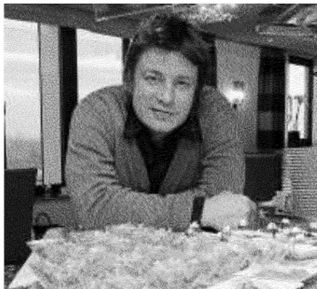
Lo chef Jamie Oliver, un'icona internazionale per il "finger food"