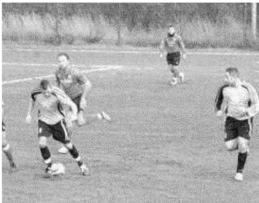
Gli Amatori tornano in campo nel prossimo weekend quasi al giro di boa dei vari campionati