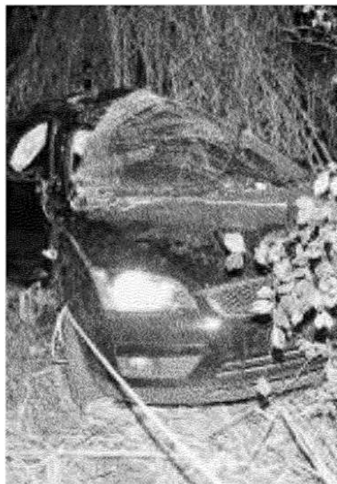
Un'immagine di un recente incidente avvenuto all'incrocio del ponte alla Navetta