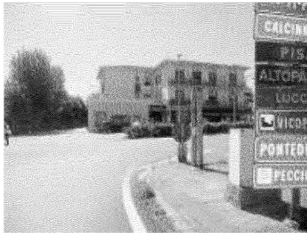
Uno scorcio della zona sott'accusa per la mancanza d'illuminazione