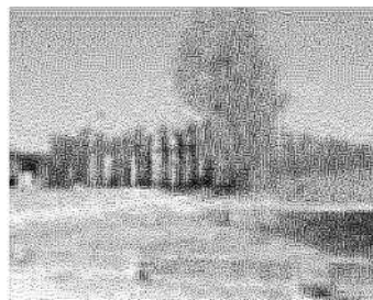
La stazione ecologica di via del Marrucco

A volte «si ha l'impressione di doversi tutelare dalle ingiustizie e dalle prevaricazioni di un servizio pubblico, che dovrebbe stare dalla parte dei cittadini».