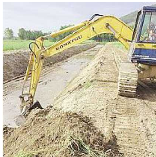
SCAVI IN CORSO Gru all'opera nei corsi d'acqua

per un investimento di altri 46mila euro: qui lo scavo riguarda il Fosso Serezza, i Fossi in località Risaie, il Rio Caselle e il Rio Ai Pratini. Nel bacino Bientina-Calcinaia (tra Bientina, Calcinaia e Vicopisano), 17 i rii posti in manutenzione (tra cui Fosso di Fungaia, Rio Giuntino-Cilecchio e Fossa Nuova di Bientina), per un investimento di 37mila euro. Per ulteriori informazioni e segnalazioni, è attivo il numero verde gratuito 800/999778.