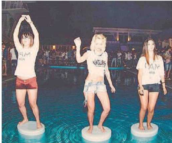
Un momento della serata inaugurale