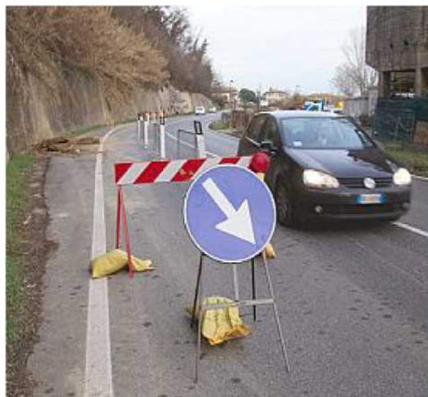
DISAGI La strada è ancora occupata dal cantiere