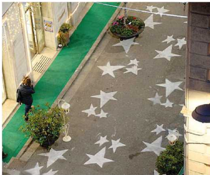
Uno scorcio di via Gotti durante una iniziativa