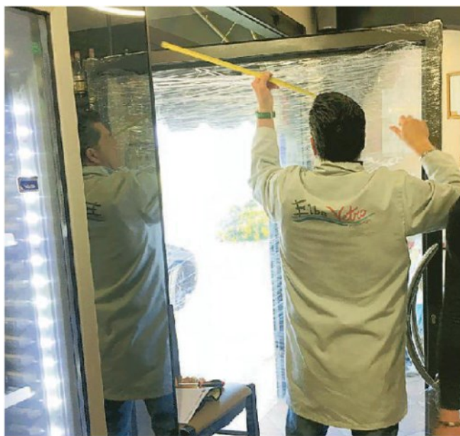
Si riparano i danni al bar "Scacco Matto"

so, le indagini vanno avanti senza sosta. Più furti sono stati «consumati» sotto gli occhi delle telecamere che hanno ripreso i malviventi. A volte i ladri agiscono incappucciati, con i volti parzialmente travisati. In alcune circostanze, come è successo in una palestra di Fornacette hanno agito, invece, a volto scoperto. Sul ladro con la frangetta e gli occhiali da vista si sono concentrate alcune indagini. Spesso però, anche se gli autori dei furti vengono immortalati mentre sono in azione, risalire alla loro identità può diventare un vero rompicapo. Così come può succedere che dal particolare di un capo di abbigliamento le forze dell'ordine riescano ad avvicinarsi ai ladri-vandali - potrebbero essere giovani - che usano bar e attività commerciali come se fossero bancomat. Le indagini vanno avanti in stretta collaborazione tra le tre forze di polizia.—