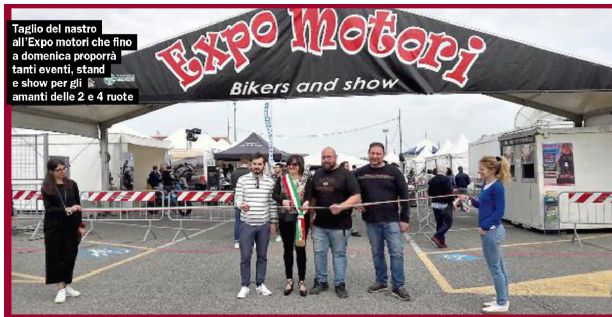
Taglio del nastro all'Expo motori che fino a domenica proporrà tanti eventi, stand e show per gli amanti delle 2 e 4 ruote