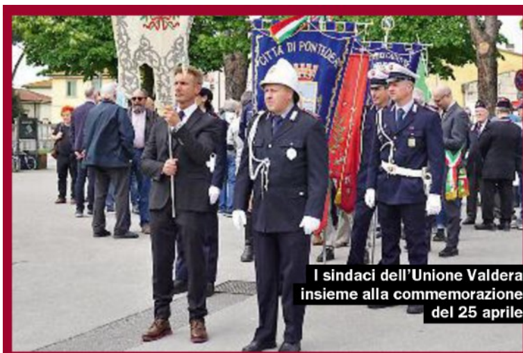
I sindaci dell'Unione Valdera insieme alla commemorazione del 25 aprile

Montefoscoli, a Palaia, in tanti si sono incamminati per la Passeggiata resistente, mentre a Pontedera ha aperto i battenti l'ExpoMotori nello spazio fiere, una manifestazione che durerà fino a domenica. La giornata si è conclusa in serata con il concertone di Fornacette, sul palco il rapper romano Piotta e il gruppo folk Modena City Ramblers.