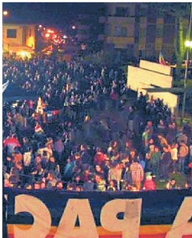
I partecipanti alla festa della Liberazione dello scorso anno

Headliners del live che prenderà vita alle ore 19, in piazza della Resistenza, a Fornacette, saranno il Piotta e i Modena City Ramblers. Prima delle performance principali, a partire dalle 17: mercatino eco-equo-solidale e opening act a cura della Borrkia Big Band. L'ingresso è libero. —