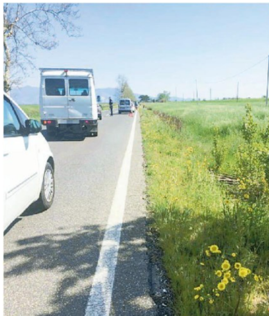
I rilievi della polizia municipale di Cascina sull'Arnaccio