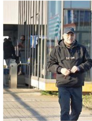
Sopra alcuni operai impegnati in una conceria. Sotto un operaio della Piaggio all'uscita dal turno