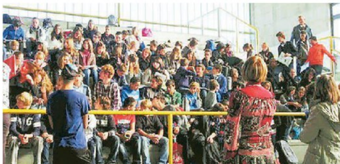
Il palazzetto dello sport di Calcinaia gremito di giovani (FOTO D'ARCHIVIO)