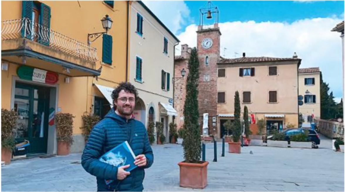
La piazza centrale di Lajatico, meraviglia dell'Alta Valdera