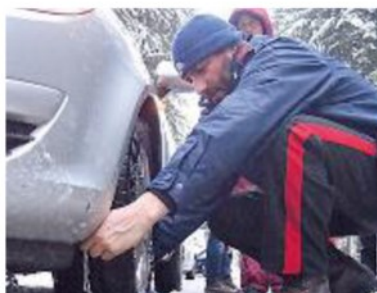
TASSATIVE Catene da neve

FINO alla mezzanotte di oggi, martedì 22 gennaio, è allerta meteo per rischio neve, criticità codice giallo (rischio medio) su buona parte della nostra provincia, dal Monte Pisano fino alla Valdicecina. La Protezione civile raccomanda alcune misure di autoprotezione: anzitutto non mettersi in viaggio se non strettamente necessario; avere dotazioni invernali (catene e/o pneumatici invernali); tenersi costantemente informati tramite i canali dei Comuni e della Regione Toscana.