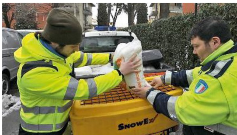
PRONTI Pisa si prepara con i mezzi anti-neve con 70 tonnellate di sale e sette mezzi con sei lame sgombraneve, più cinque spargisale