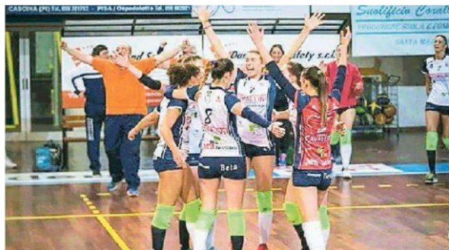
L'esultanza della squadra dopo una vittoria