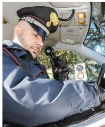
L'intervento dei carabinieri

E LA SERATA di lunedì è stata movimentata anche a Pontedera, alla gelateria Era Glaciale sulla Tosco Romagnola dove un giovane ha dato in escandescenze tanto che i titolari del locale e alcuni clienti hanno chiamato i carabinieri, temendo che il trentenne potesse mettere in pratica gesti autolesionistici o potesse far male a qualcuno. I militari hanno contattato la famiglia che è arrivata in via Tosco Romagnola a riprendere il giovane che è stato tranquillizzato e poi riportato a casa senza alcuna conseguenze per alcuno.