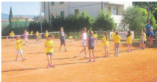
Lezioni di bambini al Tennis club di Fornacette