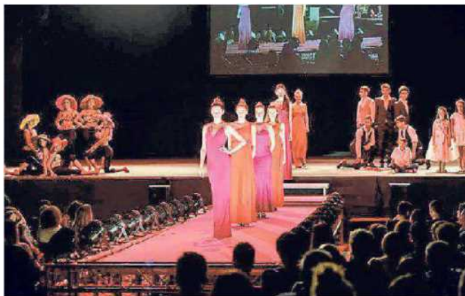
Moda, spettacolo e musica protagonisti a Fornacette