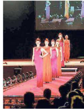
Una sfilata al Fashion Village