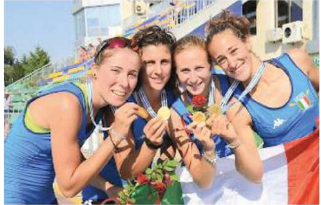
BRAVISSIME Grande soddisfazione per la canottieri