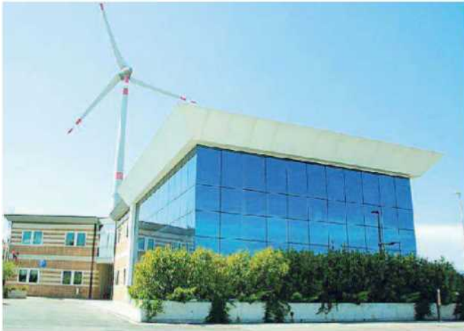
La sede di Ecofor a Gello