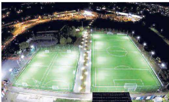
Una veduta dall'alto del nuovo impianto sportivo Masoni a Fornacette